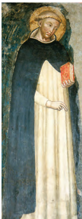
Saint Dominique, portrait du 13 e siècle

vie éternelle. En témoigne le dialogue qui commence la cérémonie du baptême :