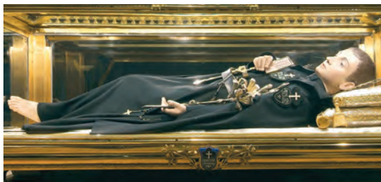
Saint Gabriel de l'Addolorata

JE CROIS que vous seule avez accompli, dans toute sa perfection, le précepte : « Tu aimeras le Seigneur. » Je crois que dès le premier instant de votre existence, vous avez surpassé l'amour de tous les hommes et de tous les anges envers Dieu, et que les bienheureux séraphins pouvaient descendre pour apprendre, dans votre cœur, la manière d'aimer