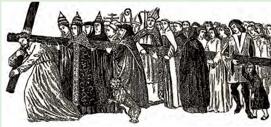
L'humanité s'associant aux souffrances du Christ. (Fresque du 15 e siècle, église de Chauvigny)