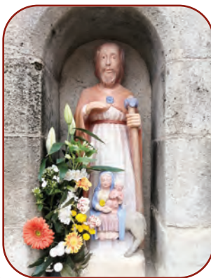
Statue de saint Joseph