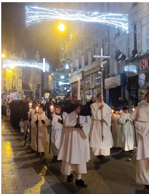
Procession du 8 décembre

JE CROIS que si l'on réunissait l'amour que toutes les mères ont pour leurs enfants, tous les époux pour leurs épouses, tous les saints et tous les anges pour ceux qui ont de la dévotion envers eux, cet amour