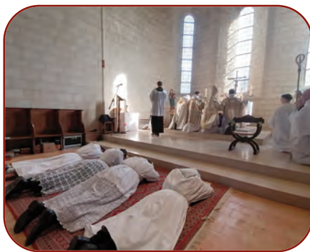
Sous-diaconat, 1 er mars