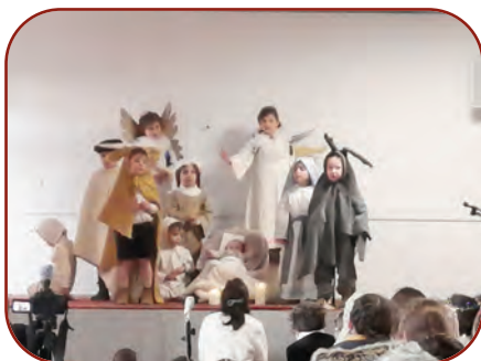
Pièce de Noël de l'école primaire