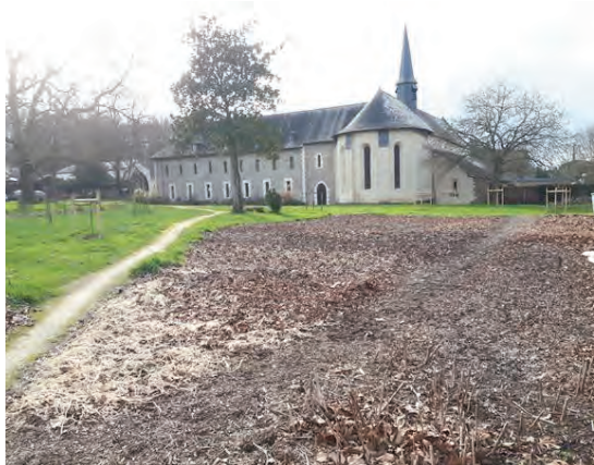
Le couvent vu de derrière, en hiver

charité elle-même doit être guidée par la prudence. Il ne faut pas, sous prétexte de charité, négliger son devoir d'état (avis aux parents qui négligeraient leur famille pour des activités soit-disant charitables), ni se comporter de la même manière avec les catholiques et les non-catholiques, ni, parmi les catholiques, avec une personne qui suit la ligne de conduite de Mgr Lefebvre et avec un conciliaire ou un sédévacantiste.