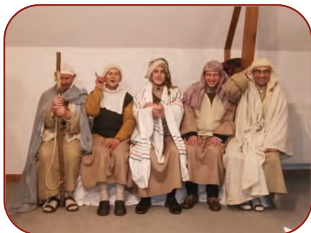
Après-midi récréative, 1 er janvier

❑ Dimanche 29 décembre. Arrivée de la communauté de Bartrès au grand complet pour se ressourcer au couvent et renforcer les liens